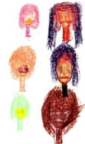
SMILES!!! by Navita Mika