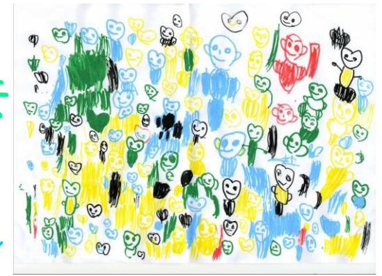
作: 戒井優理 (カプカプ竹山)