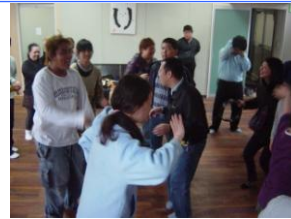
4月28日 平塚 COOCA